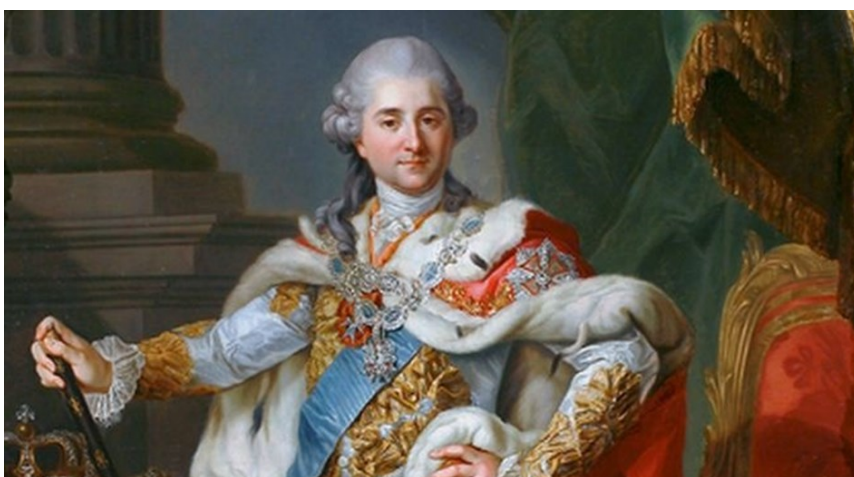
król Stanisław August Poniatowski

W ten sposób 14 października 1773 powołano do życia pierwszą na terenach Rzeczypospolitej, ale i w Europie, instytucję o charakterze dzisiejszego ministerstwa oświaty.