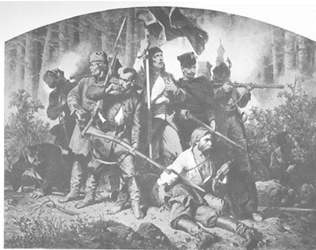
Artur Grottger Bitwa

Polacy byli nieustępliwi, dlatego zakładali organizacje konspiracyjne. Działacze o radykalnych poglądach nazywano czerwonymi. Pragnęli oni przygotować kolejne powstanie narodowe. Inną organizacją spiskową o bardziej zachowawczych poglądach byli biali, którzy przeciwstawiali się walce zbrojnej. Uważali, że do powstania należy się dokładnie przygotować oraz zdobyć poparcie mocarstw zachodnich – Anglii i Francji.