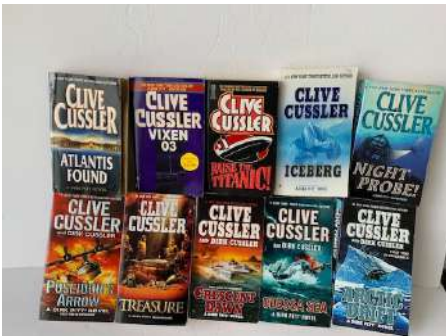
Zdjęcia książek znaleziono w Internecie.