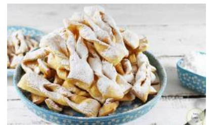
Faworki (chrust) - przepis (domowe-wypieki.pl)

papierowym z tłuszczu. Gdy ostygną posypać grubo cukrem pudrem.