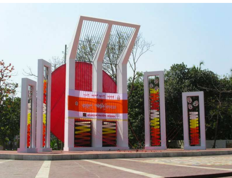
Shaheed Minar (pomnik Męczennika) przed uniwersytetem w Dhace (Bangladesz)

Język ( za: Słownik Języka Polskiego, 2008)- system znaków dźwiękowych i pisanych służący do porozumiewania się członkom danego narodu.